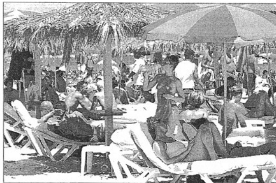
Imagen de una playa de Eivissa

La población de Kauai se divide en cinco grupos: gente de raza blanca, filipinos, japoneses, hawaianos y "gente de mezcla", afirma el estudio. Según The Official Bureau of the Census, el 34,8% son blancos, el 24,8% son filipinos, hay un 20% de japoneses, un 15% de hawaianos y un 23,5% de mestizos.